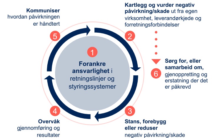
Figur 1: OECDs veileder for aktsomhetsvurderinger for ansvarlig næringsliv